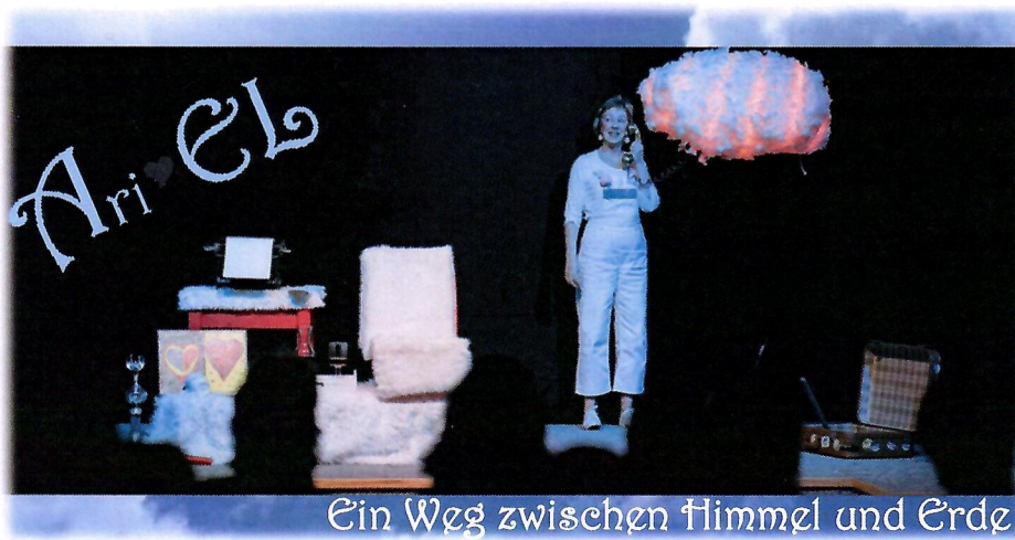
Ein Weg zwischen Himmel und Erde